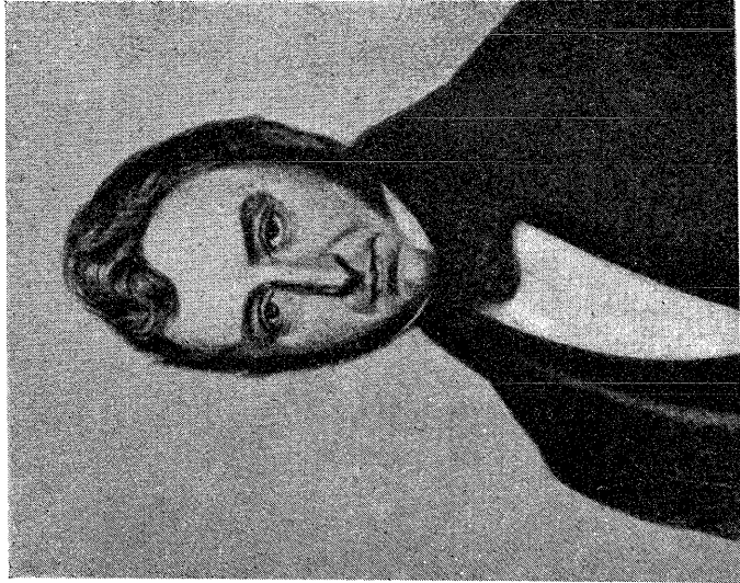
Fig. 2. Dr. G. J. MULDER (later hoogleeraar te Utrecht), lector aan de Clinische School te Rotterdam van 1828 tot 1840.